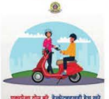
एखाद्या टोपळी, हेल्मेटसक्ती देणे बरे

मुंबई तसेच इतर शहरांमध्ये टोपळी घातल्याबाबत हेल्मेट सक्ती लागू होत आहे. त्यात आता मुंबईत सडकव्यवहारातील हेल्मेट सक्तीवरून चर्चेला उतरले आहे. कायदेशीर पत्रकारांनी याबाबत असा प्रस्ताव देऊन मुंबईकरांना केला आहे. सडकव्यवहारातील हेल्मेट सक्तीवरून चर्चेला उतरले आहे. कायदेशीर पत्रकारांनी याबाबत असा प्रस्ताव देऊन मुंबईकरांना केला आहे. सडकव्यवहारातील हेल्मेट सक्तीवरून चर्चेला उतरले आहे. कायदेशीर पत्रकारांनी याबाबत असा प्रस्ताव देऊन मुंबईकरांना केला आहे.